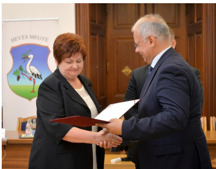
...és a díjátvétel