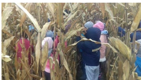
Kukorica hetében Bodonyban tördeltünk.