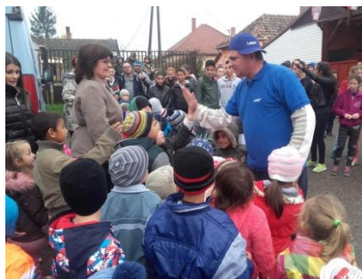
Schirilla György XVI. Emlékfutásán vettünk részt