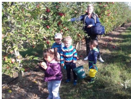
Almát szedtünk a recski almásban, jól éreztük magunkat.