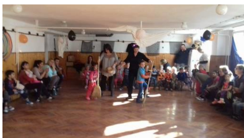
Halloween party az óvodában