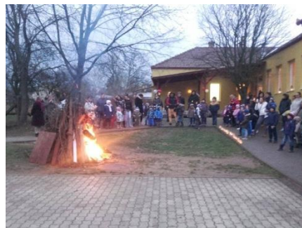
Márton-napi fáklyás felvonulás után