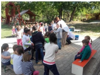
Ez a hét a szőlőszedés és a szüret jegyében zajlott. Szüreteltünk, szőlőt daráltunk és préseltünk. Szüreti felvonulást szerveztünk.

Az óvodában a kötelezően megtartandó foglalkozásokon kívül rendkívül sok programmal színesítjük a gyermekek mindennapjait. Ősszel volt Szüret hete, Állatok hete, Kukorica, Liba, Tök hete és még sok-sok különféle program.