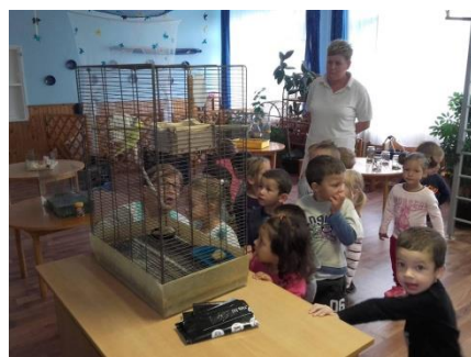
Megünnepeltük az állatok Világnapját.