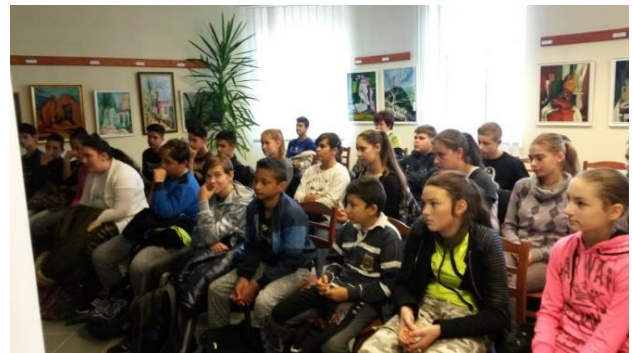
Elsősegélynyújtás alapjai - oktatáson a tanulók

biztosításával sikeresen meg tudtuk oldani. Ezek a következők voltak: nőgyógyászati szűrés, csontritkulás vizsgálat, hallásvizsgálat, vérnyomás-, vércukor- és PSA mérés, melyeken összesen 114 fő vett részt. Ugyanezen keretek között október 20.-án az iskola 7. és 8. osztályos tanulóinak tartottunk az elsősegélynyújtás alapjaiból előadást.