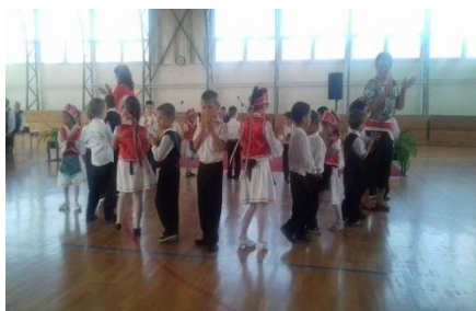
Szerepeltünk az Idősek Napján.