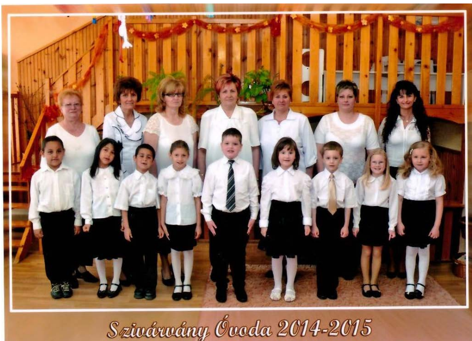
Szivárvány Óvoda 2014-2015

Május utolsó vasárnapján szép napsütéses időben lufi és virágdíszbe öltözött az óvoda. Délután az udvaron gyülekeztek a szülők, nagyszülők, rokonok, hogy megnézzék milyen ügyesek, talpraesettek gyerekeik. Egy év alatt sokat fejlődtek, okosodtak, s új verseket, dalokat tanultak, amiről most számot is adtak. A hagyományoktól eltérően az összes óvodás szivárvány táncával nyitottuk meg a műsort, ami nagy sikert aratott. Ezután a nagy-középső csoportosok rendkívül színvonalas angol bemutatója következett. A kiscsoportosok és a nagy-középső csoportosok után a ballagó nagycsoportosok búcsúztak az óvodától és társaiktól, hiszen őket már az iskolapad várja. Gyönyörű, táncos-zenés műsorral köszöntek el az óvodától. Szívünkhöz nőttek és hiányozni fognak szeptemberben. Jó pihenést és kellemes nyarat kívánunk minden óvodás gyermeknek és szülőnek.